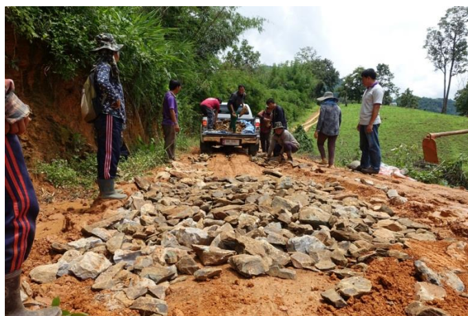
村の山からの岩を砕き粘土の道に敷く協働作業。