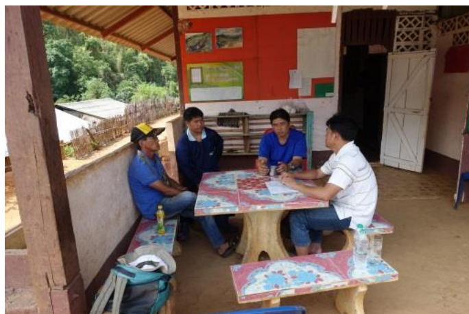
ホイドウア村 住民学校 (タマサーと大学生ボランティア活動で建設)