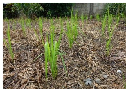
事務所裏の空き地に陸稲（種モミ）蒔き（7/12） 種モミ 10～15粒＋化成肥料数粒 種モミ蒔きから19日が経過（7/26）

・7月13日 地域行政との協働連携事業 昨年度の事業報告と平成28年度からの事業説明と協力をお願いしました。