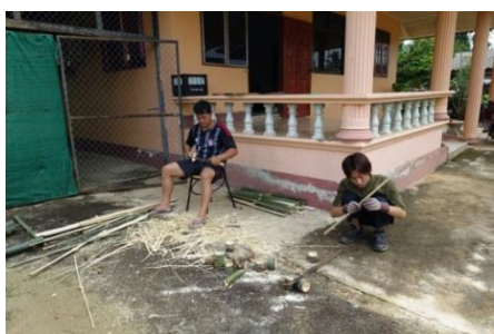
表示用竹杭の作成 (研修生体験学習)

・8月19日～8月28日スタディーツアー 恒例の徳島大学・山口県立大学それぞれの行事や都合により参加者3名となり、うち、全行程は1名と寂しいフィールド学習と成りましたが、結果それぞれの地で大歓迎を受け内容の濃い実りある学習でした。(PHAYAOレポート2016-01 徳島大学 岡村英作 参照)