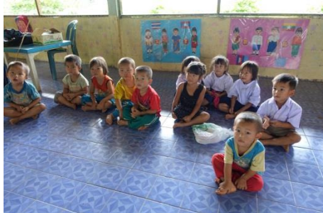
ホイプム村保育園訪問