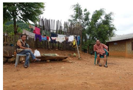
ホイドウア村環境調査指導 (チェックカ所の確認)