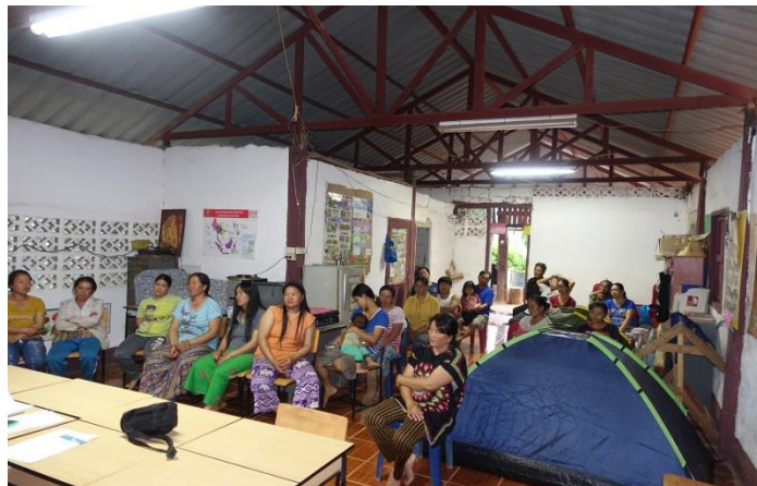
ホイドウア村（シャンティ山口プロジェクト実施計画住民説明会）

・7月12日 本年4月より事務所を移転 裏の空き地に陸稲を蒔きました。11月には新米が食べられます。皆さんのお越しをお待ちしています。