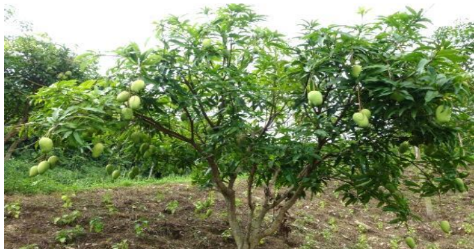
ホイプム村北側農地-1の果樹植栽状況（約70ha トウモロコシから果樹への転換地）