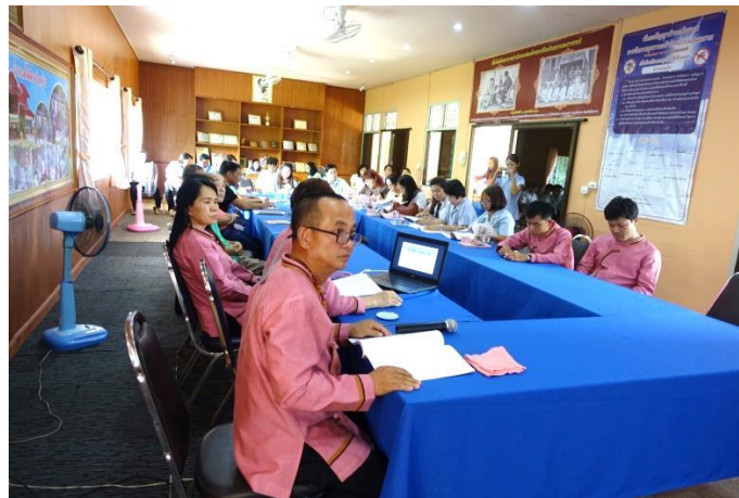
保健所行政監査（実績報告の内、連携協力によるシャンティ山口の活動実績・計画報告）

・7月14日 昨年で助成事業を終了 ホイプ村（環境調査は、新規実施）住民による熱心な手入れが行き届き枯れ苗木もなく順調な成育を確認しました。