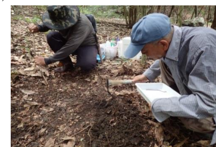
ホイドウア村調査実践指導 (飲料用水源地・自然林・土壌)

・9月2日 野生らん生存確認 世界各地の野生らんは、気候変動による森林の変容や、乱獲により多くの希少種が絶滅の危機にあります。ワシントン条約での指定絶滅危惧種が現地では、ほとんど見られなくなりました。人間生活エリアでは、森林伐採はむろん農薬・除草剤により多くの動植物が消滅しているのが現状です。今回発見のハバナリア属 (Hab.rhodocheila) も、この地域では、数少ない希少種で住民の理解を得て、これから先農薬・除草剤との関連など継続的に調査、保護していくことをお願いしました。