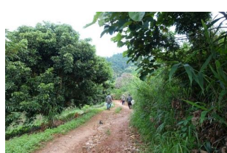
ホイドウア村調査実践指導 (農地・自然林)