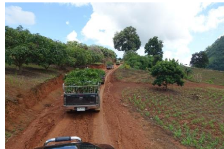
「緑の募金 GreenFund」 苗木運搬6トン車1台・ピックアップトラック4台2往復