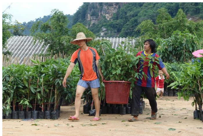
「緑の募金 GreenFund」 配布作業 3日間にわたる村人総出の協働作業