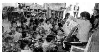
バンカー村保育園での絵本の読み聞かせ