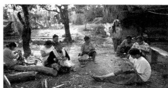
伝統文化継承事業・民族衣装の刺しゅう作業