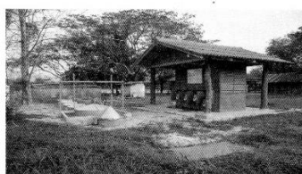
完成したみんなのトイレ(センサイ村)