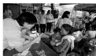
保健衛生プロジェクト・投薬の説明