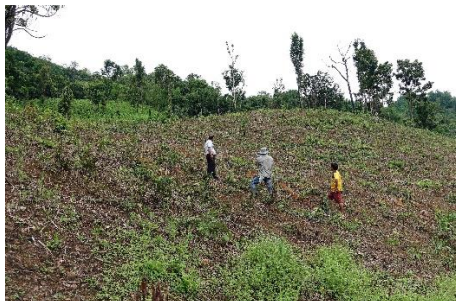
植栽地の成育・病害虫調査