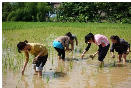
シャンティ学生寮での田植え体験