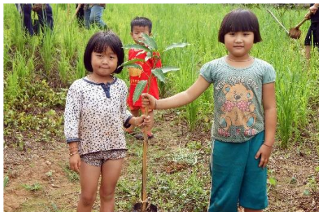
「私のマンゴーの苗を育てます」