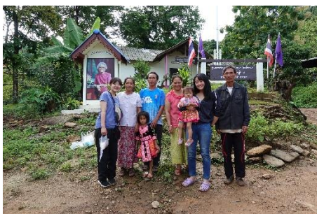
ホストファミリーとのお別れの日