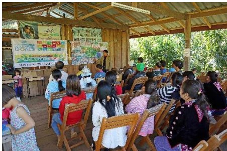
SDGs（国連キャンペーン持続可能な開発目標）セミナー（ナムカー村）