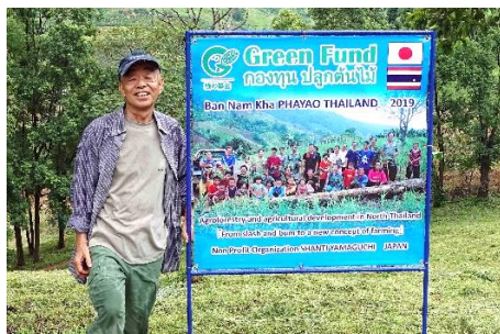
Green Fund 実施看板（佐伯事務局長）