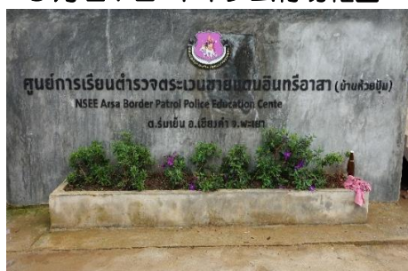
国境警察隊所管 ホイプム村民族開発幼稚園・小学校学校