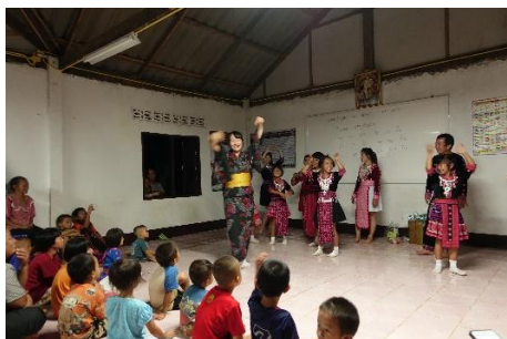
ホイブム村での交流会