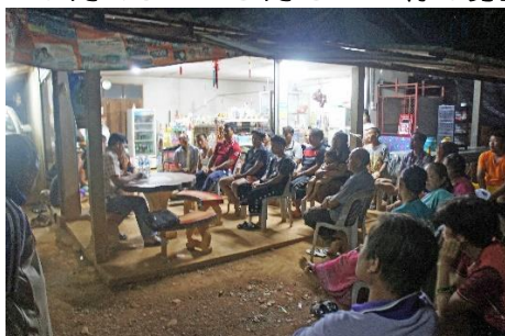
村民会議（プロジェクト協議）