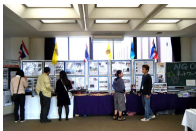
NGO ネットワーク山口 の総合ブース

主催：「世界みんなの笑顔のために」実行委員会 共催山口大学・（財）国際協力推進協会