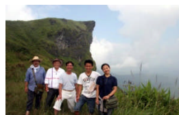
ブーチーファア(2008年)