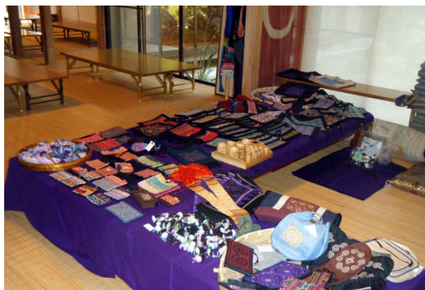
セーンサイ村女性グループの刺繍小物入れが超人気でたくさん売れました