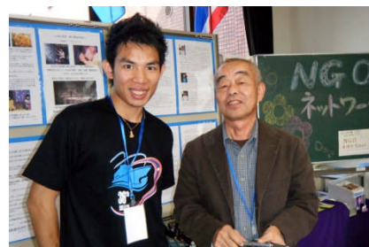
ラオスから（アジア交流の船に参加の研修生）と