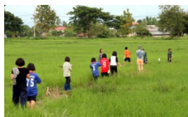
寮生による農作業