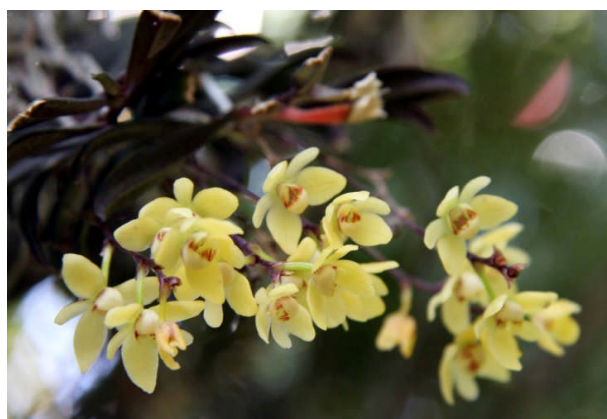
法明院の「カシの木らん」