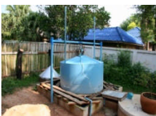
ガス収集システム