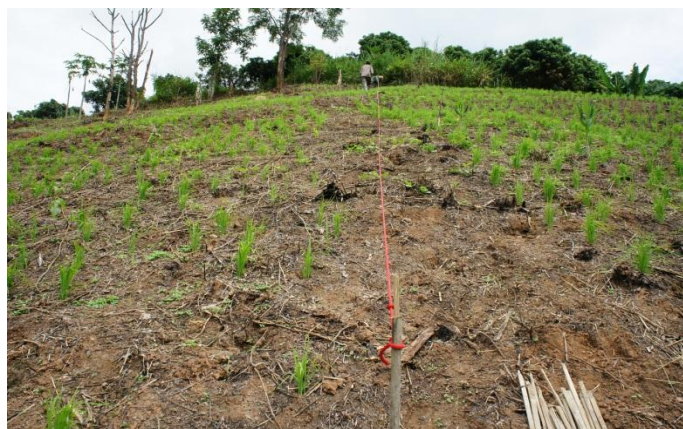
地力回復のための稲作 (マカダミアナッツ・アボカド・みかん用地)

ホイプム村 農業センター (昨年に比べ樹木が目立つようになりました。) 農業試験栽培場