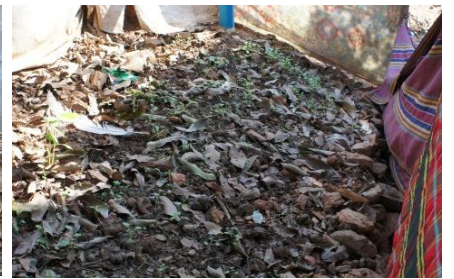
NO.11 Sua Saeyang