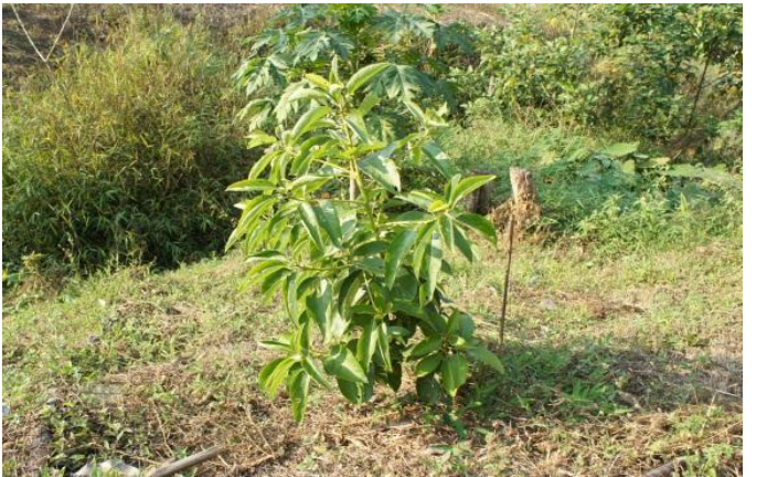
アボカド成長が早く3年後には、収穫できそうです。