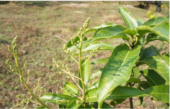
マンゴーの苗木 2012.4月実がつけそうです。