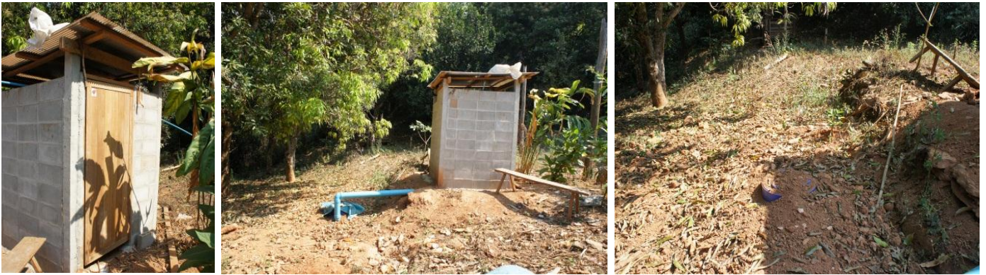
NO.15 Yuttasak Songyangyunkul