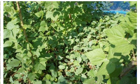
NO.12 Wichian Saeher