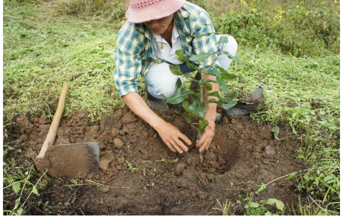
マカダミアナッツの植栽