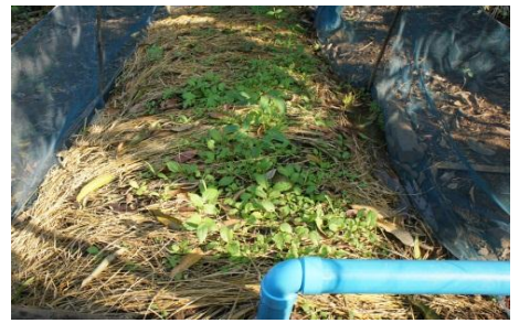
NO.5 Laosue Saeyang