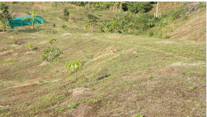
苗木植栽から2年が経過し目立つようになりました。