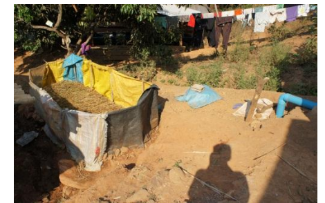
NO.7 Laoneng Saeyang