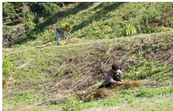
稲わらによる苗木のマルチング作業