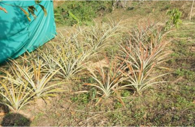
パイナップル（品種ナンレー・プーレー）全部に実がつけました