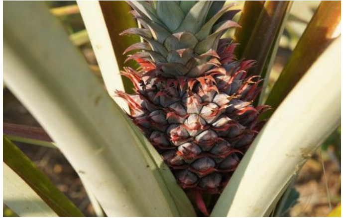
ナンレー種 2012.5月には収穫できます。