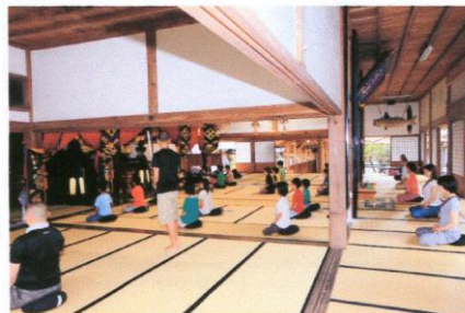
洗面・ラジオ体操の後は坐禅・朝のお勤め！