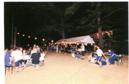
夜は手作り縁日です!(^^) 境内のライトアップは長門市観光コンベンション協会様ご協力のもと雰囲気バッチリです！

実は…子ども達には気づかれないよう内緒で事前に我が子宛てたお手紙をご両親にお願いしておきました。