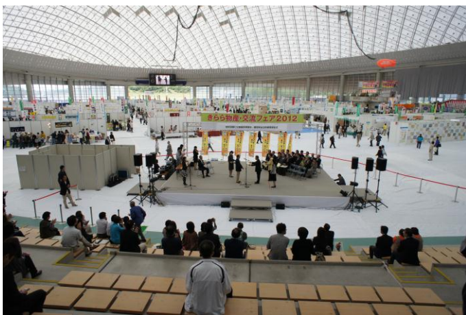
オープニングイベント

シャンティ山口のブースも多くの訪問者があり活動報告や、ビデオ鑑賞でにぎわいました。