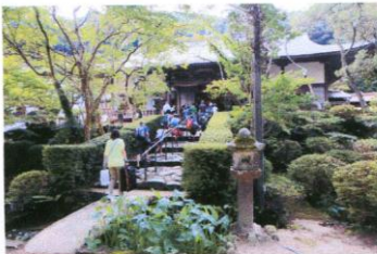
長門市大寧寺到着。 長旅大変お疲れ様でした！

・初日 山口県への移動 ・2日目 「関門海峡横断—海響館」 夜「大寧寺」 ・3日目 午前中「秋芳洞」、午後「萩焼会館—三見小学校プール」 夜「夜の集い（レクリエーション・宝探し）」