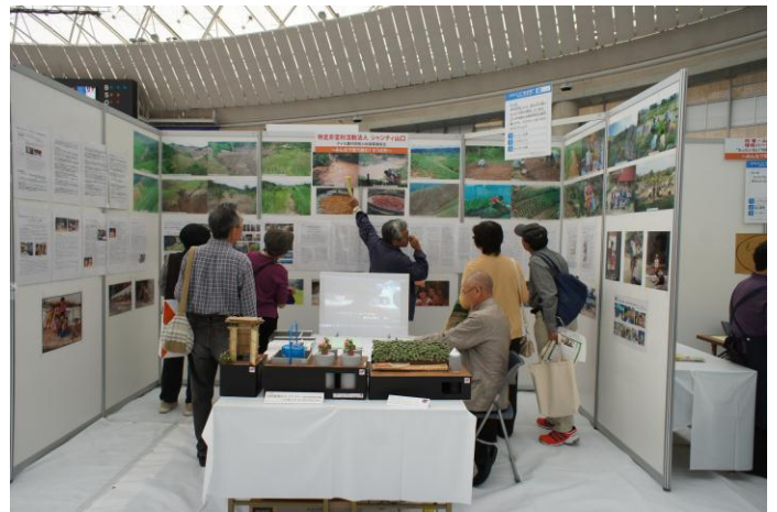
「タイの農村開発と地域環境保全」