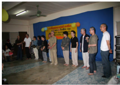
日本からのお父さん・お母さん達