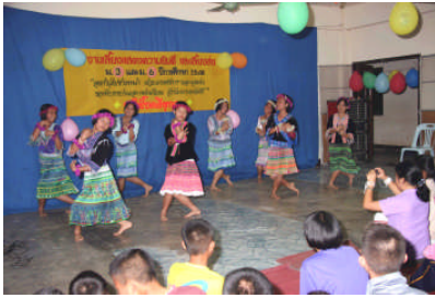
寮生による「モン」の伝統芸能