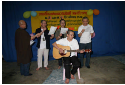
毎年お祝いに訪問している青年会のお兄さん達