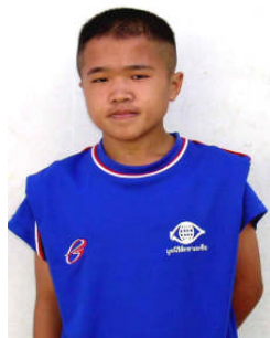
ターワットチャイ・セーソン チェンカム機械専門学校