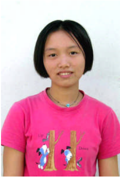
ドウオン・ナバー チェンマイ高校