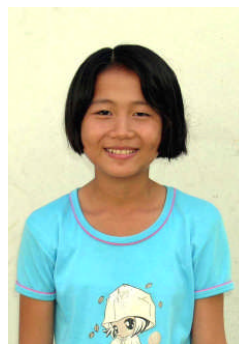
スパトラー・セーヤン チェンカム高校