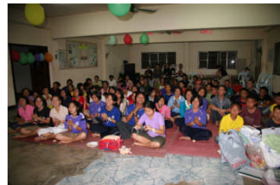
“みなさんありがとう”