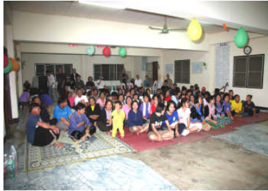
父兄の皆さんと寮生