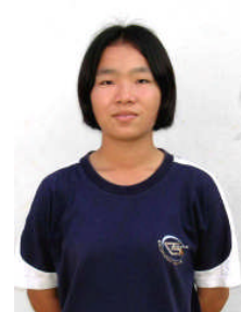
スパソン・パナヴァンルーン アユタヤ専門学校