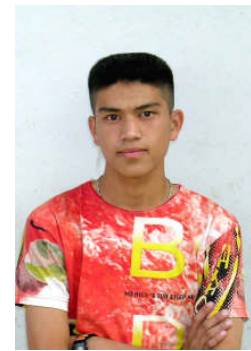
トウアー・セーソン ラチャパチェンライ大学