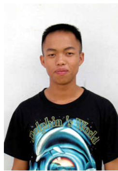
チューチャー・セーヤン ラチャパチェンライ大学