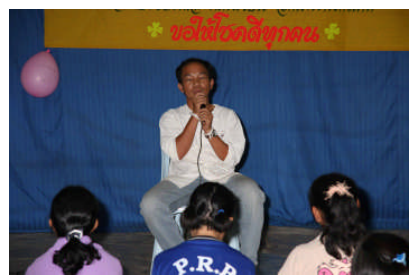
ガランスタッフからの挨拶