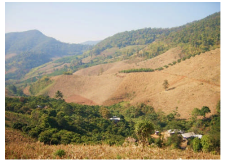
トウモロコシ畑と保育所（右下）