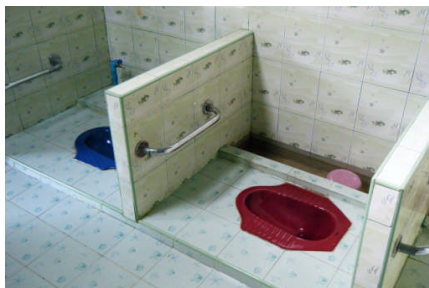
こどもトイレ完成