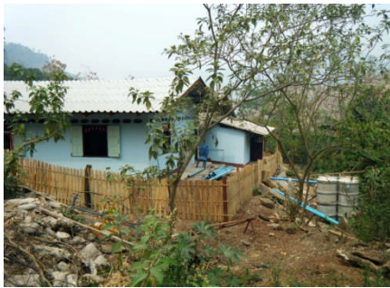
多目的教室とトイレ