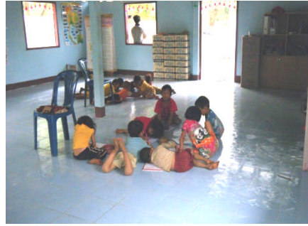
多目的教室でのお絵かき