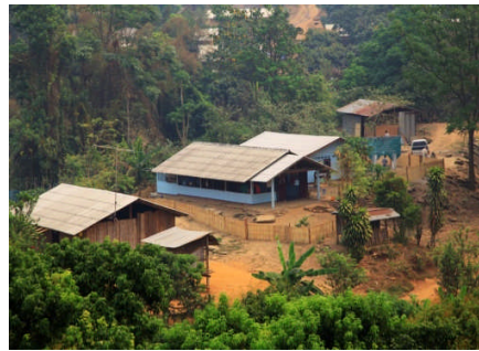
保育園全体〔中央部分〕