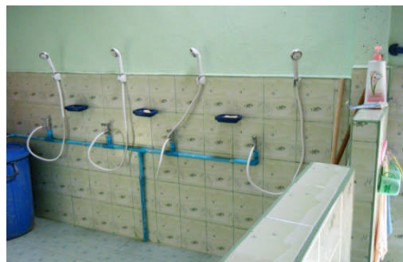
こどもシャワー完成