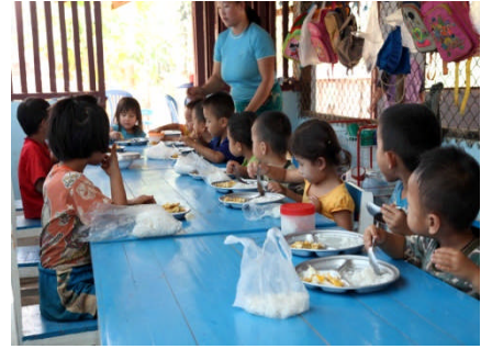
軒先利用の食堂完成