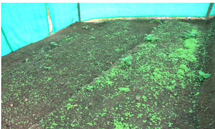
播種用床（コーヒー・茶を植え付け予定）