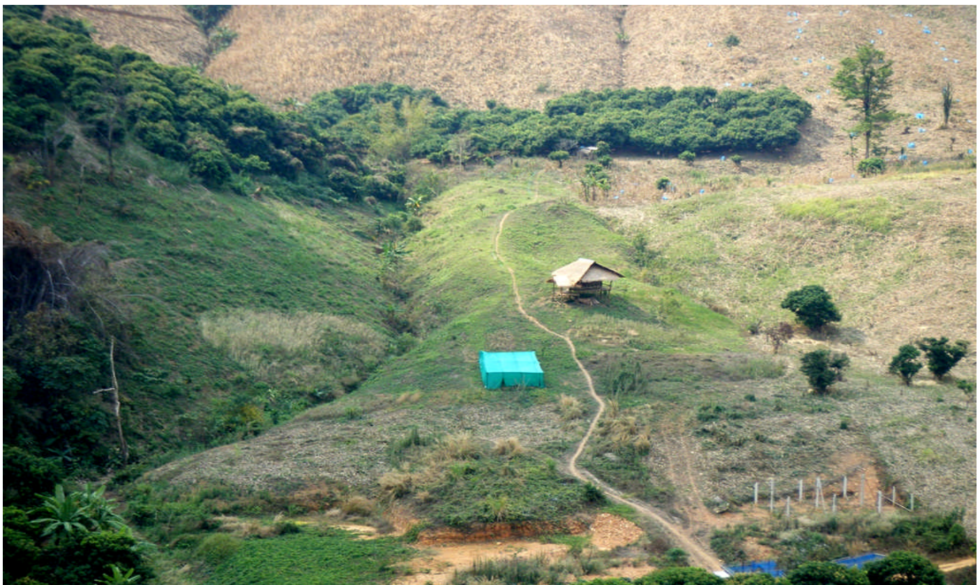
ホイプム村 農業センター（資材、作業小屋・陽避け苗床） 農業試験栽培場

「From slash and burn to a new concept of farming」