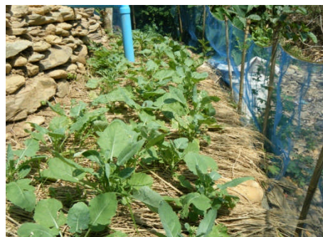
NO.9 Napatson Saelee