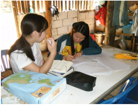
アンケート集約作業